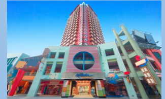
ホテル近鉄ユニバーサル・シティ