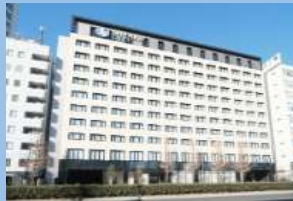
都シティ東京高輪