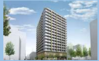
都シティ大阪本町