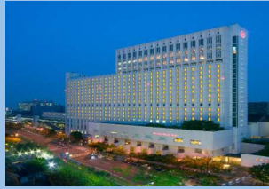
シェラトン都ホテル大阪