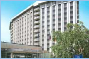
シェラトン都ホテル東京